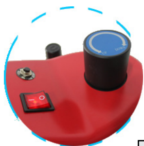
REGULADOR DE ALTURA DE PLATO

Dispone de control de Tiempo y Temperatura Digital. Alarma Automática. Acomoda materiales de hasta 53mm de espesor. Presión ajustable para adaptarse a diferentes materiales. Botón de parada