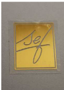
transferencia del motivo

MetalFlex es adecuado para algodón, poliéster u otros tejidos mixtos. No es tan recomendable para nilón u otros tejidos con acabados. Se puede lavar hasta 40 °C.