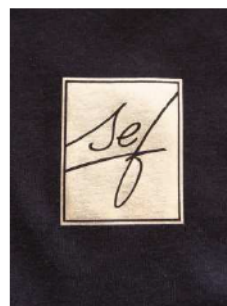
Retirar la lámina del soporte y listo

MetalFlex está disponible en 7 colores, otros colores a petición.