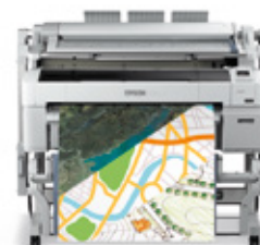
Impresoras de 36"