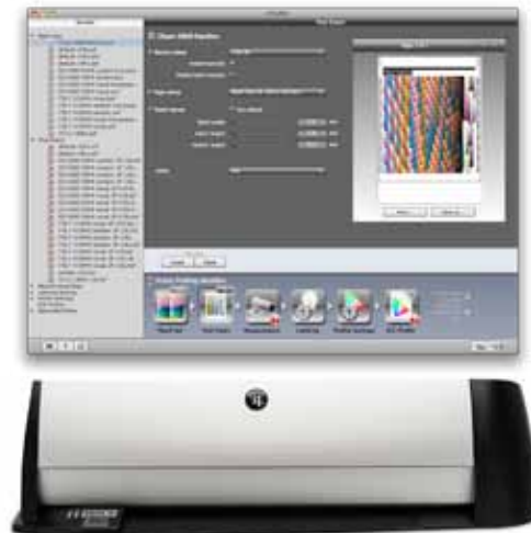
i1iSis 2 e i1 Profiler: velocidad y facilidad de uso combinadas

www.xrite.com/i1isis-2-automated-chart-readers