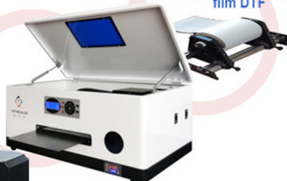
Impresora DTF con doble cabezal XP600