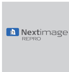
Software Nextimage REPRO