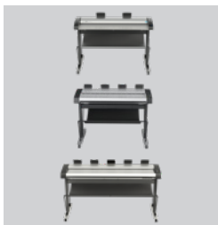
Elección de escáner IQ Quattro X de 44 pulgadas HD Ultra X de 42 pulgadas HD Ultra X de 60 pulgadas