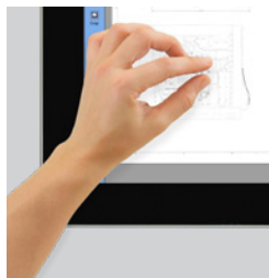
Pantalla táctil Pantalla táctil Full HD de 21,5"