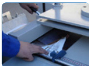
Hendido de los pliegos