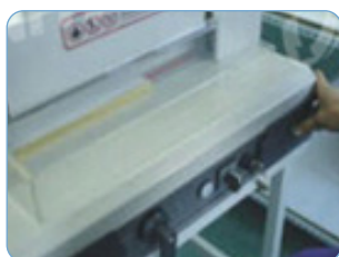
Guillotinado (refilado del álbum fotográfico)