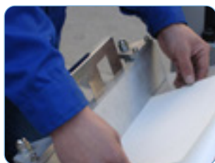
Montaje pliego contra pliego