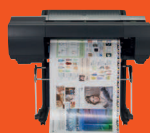
iPF6450 con opción de espectrofotómetro