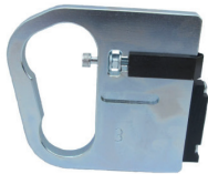
TH#3A ACM V-Groover*