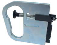
TH#3B Acrylic scorer *