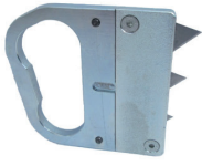
TH#1 Utility blade