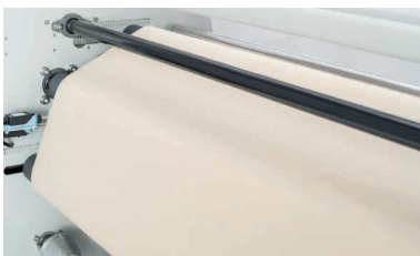
Tapete de fieltro de alta calidad.