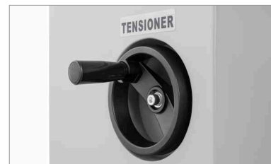
Ajuste de tensión del tapete.