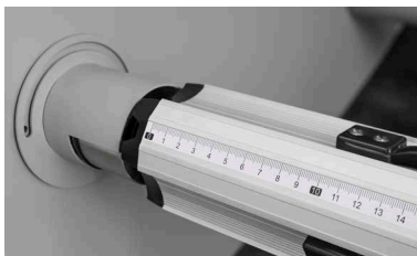
Escala milimétrica en el eje para la colocación correcta del material.