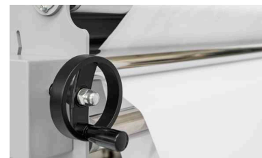
Ajuste de tensión de la tela.