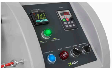
Panel de control para configurar la velocidad y la temperatura.